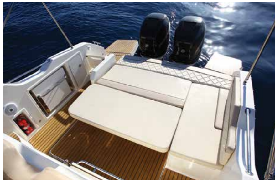
En abaissant la table puis en inclinant le dossier vers la poupe, un vaste bain de soleil (1,85 x 1,60 m) se découvre.