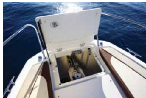
Très fonctionnelle avec sa grande capacité et sa trappe d'ouverture sur vérin, la baille à mouillage se montre pratique.