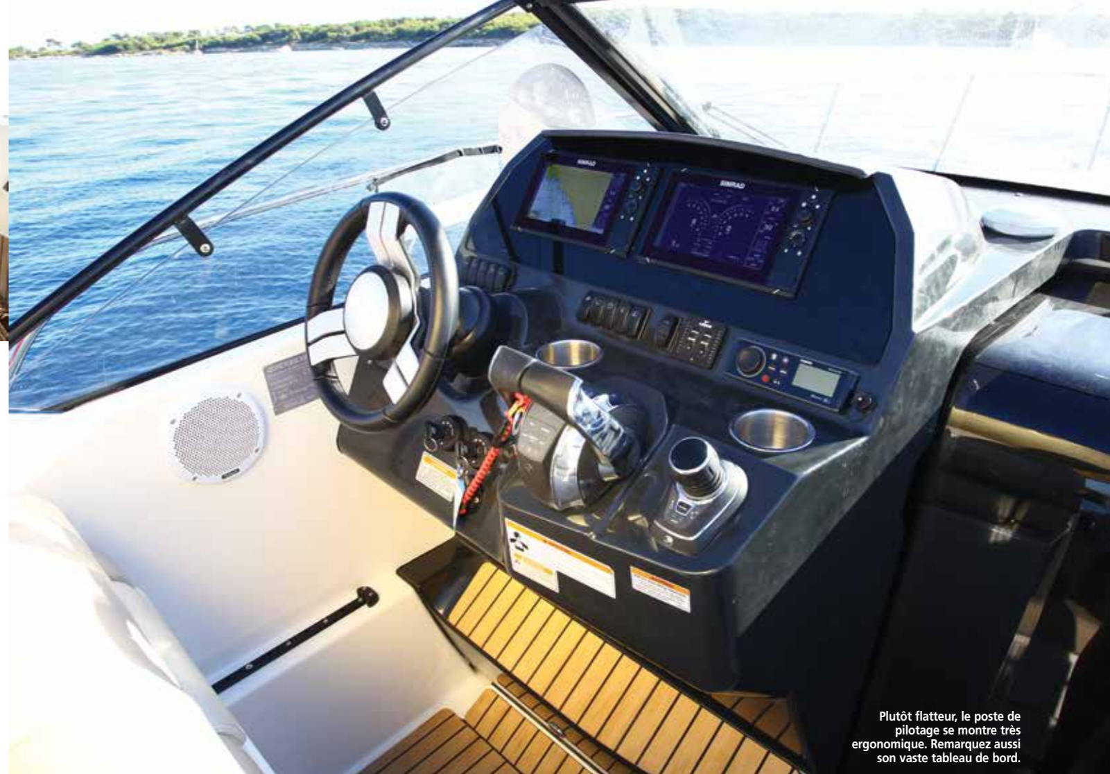
Plutôt flatteur, le poste de pilotage se montre très ergonomique. Remarquez aussi son vaste tableau de bord.

mouillage sera un régal à utiliser en arrivant dans une crique. Sa large ouverture assistée par un vérin à gaz offre un accès facile à la chaîne et la présence du guindeau optionnel monté sur une robuste platine inox ne gêne en rien la manipulation du mouillage. Pour rejoindre le cockpit arrière situé en contrebas, des passavants latéraux ceinturés par de hauts balcons sont à disposition. Le passage tribord affichant 0,39 m de large sera le plus souvent privilégié tandis que celui sur bâbord mesure seulement 0,22 m. Trois marches plus bas, le cockpit du 875 Sundeck se montre des plus accueillants avec ses nombreuses banquettes. La sécurité n'est pas non plus oubliée car les pavois culminent à 0,87 m, les pères de famille peuvent naviguer sereins. Doté d'une