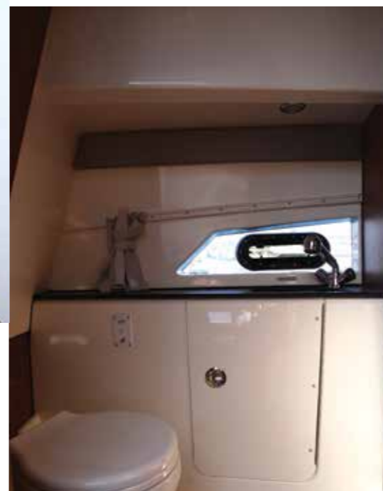
La salle d'eau délivre un joli volume et dispose de tout le nécessaire pour s'évader en petite croisière.