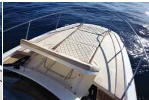
Sur le pont avant le vaste bain de soleil (2,25 x 2,00 m) dispose d'un dossier inclinable suivant 4 positions.