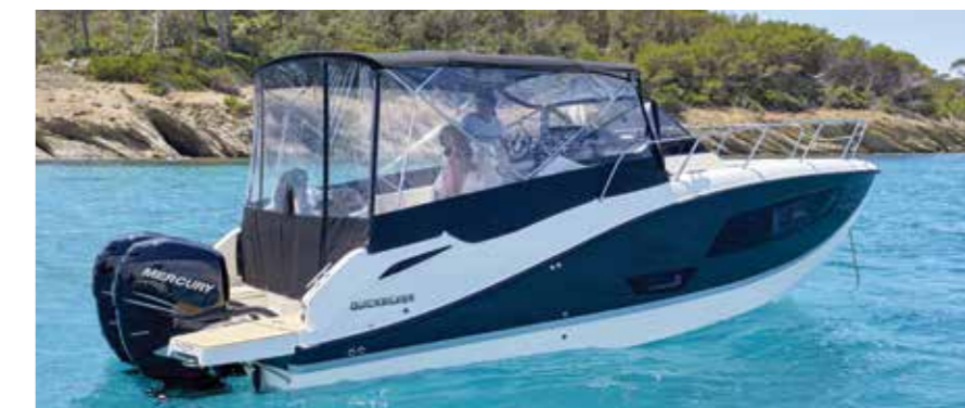
En option, le bimini combiné au taud de camping permet d'abriter le cockpit. Un véritable atout en croisière.

dans le salon de pointe. Capable d'accueillir pas moins de 7 invités autour de sa table amovible celui-ci reçoit de hauts dossiers favorisant le confort. A la nuit tombée cet espace peut aussi se convertir en lit double de 1,90 x 1,50 m. Des équipets ceinturant ce salon puis des coffres logés sous les banquettes sont notamment à notifier. Sur le côté tribord un meuble pouvant recevoir une micro-ondes ainsi qu'un réfrigérateur optionnels permet encore d'agrémenter le confort de ce chaleureux habitacle. Enfin, une mid-cabin située derrière la descente et fermée par un rideau pour davantage d'in-