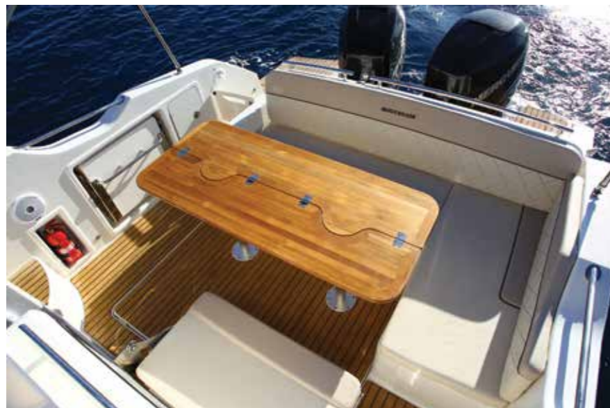
Le salon en L peut accueillir jusqu'à 8 invités autour de sa table grâce à des banquettes escamotables.