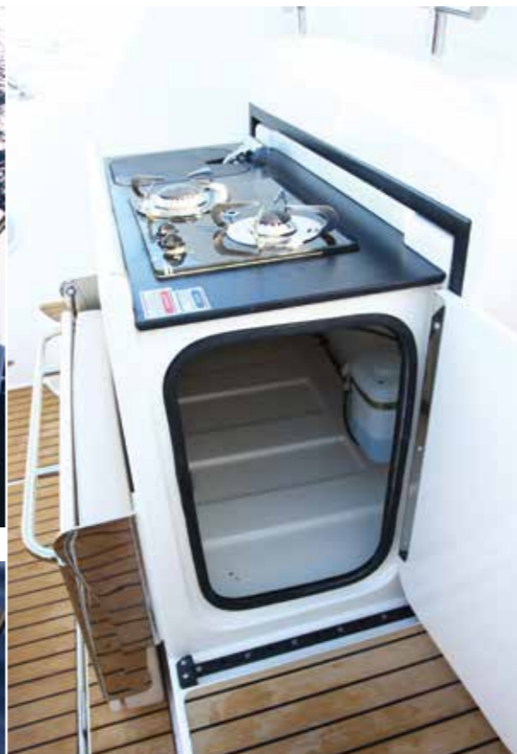
La cuisine de cockpit comprend un grand espace de rangement accessible par le côté. Toujours utile !

banquette en L accolée sur bâbord, le salon peut accueillir jusqu'à 8 convives autour de sa table amovible grâce aux banquettes escamotables optionnelles dont l'une est fixée au pavois tribord et l'autre au dos du pilote. Cette modularité permet également de dégager la circulation si besoin. Enfin comme si la surface de bronzette du pont avant ne suffisait pas il est aussi possible de convertir le cockpit en grand bain de soleil de 1,85 x 1,60 m. Pour cela, il faut abaisser la grande table et basculer complètement le dossier de la banquette de poupe. Autant dire que la manipulation n'est pas sorcière. De surcroît sachez que ce dossier peut aussi s'incliner en position intermédiaire, les amateurs de lecture au farniente seront ravis. Côté rangement, le plancher de cockpit recouvre un immense coffre de cale dont la profondeur atteint 0,80 m. Ouvrir ce rangement permet aussi de découvrir que la trappe présente des supports de fixation pour les pieds de table, la pompe à main ou encore le feu blanc amovible. Pratique ! Des coffres situés sous les banquettes de ce cockpit sont aussi de la partie. A l'heure de l'apéritif, les convives seront heureux