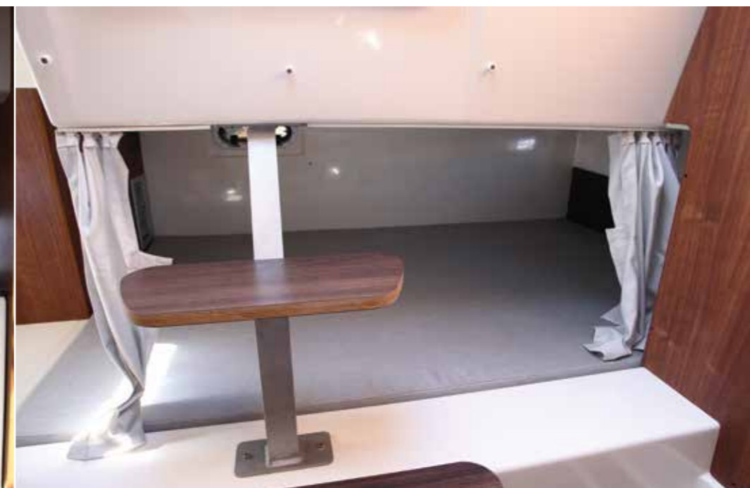
La mid-cabin installée sous le cockpit arrière présente un couchage double (1,95 x 1,30 m) logé en transversal. La hauteur sous plafond s'avère convenable puis des rideaux permettent de profiter d'un peu d'intimité.

de profiter de la belle cuisine extérieure parfaitement dissimulée sous la banquette de pilotage. Du reste pour la découvrir il ne faut pas basculer l'assise pilote comme sur la plupart des bateaux mais simplement la faire coulisser vers l'avant. Effectivement la banquette de pilotage qui recouvre la cuisine s'avère montée sur rails. C'est plutôt malin car de toute manière le poste de pilotage ne sera pas utilisé au moment de préparer le déjeuner. L'optimisation de l'espace est parfaite puis un grand coffre niché sous la cuisine est accessible en latéral. Le plan de travail comprend un évier en standard tandis que les feux à gaz et le réfrigérateur à tiroir de 20 litres sont disponibles en option. Installé sur bâbord, le poste de barre dévoile une superbe planche de bord en gelcoat noir. Suffisamment d'espace s'avère disponible pour intégrer un écran multifonctions de 12 pouces ou alors deux écrans de 9 pouces puis les manettes de gaz tombent parfaitement sous la main. En outre, le joystick de manœuvre équipant le bateau de notre essai profite également de son emplacement dédié. A cela s'ajoute la façade de la stéréo, des rangées d'interrupteurs ainsi que deux porte-verres. Pour sa part le pilote et son copilote jouissent d'une large banquette double avec assises indi-