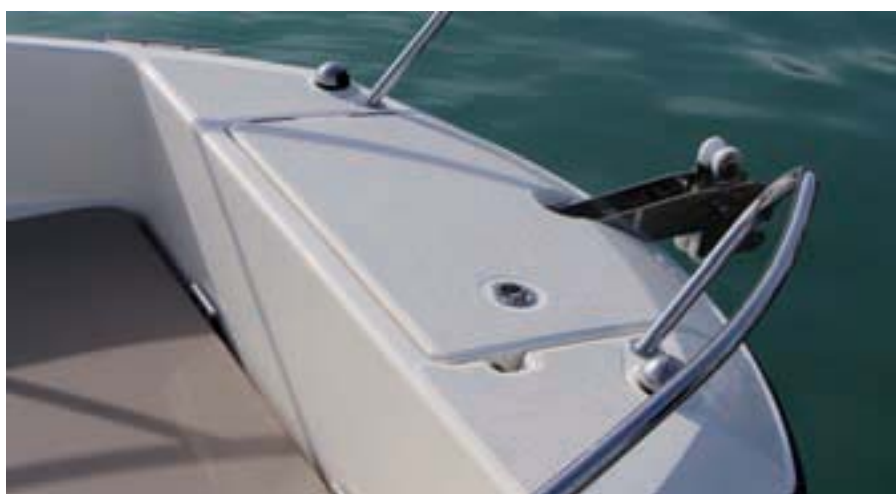
La proa se ocupa mediante una plataforma ancha con cofre de fondeo.

Se ha asegurado, de entrada, poder manejar esta nueva embarcación con la nueva licencia de navegación, situándose la Activ 605 como el modelo más grande de la gama que disfruta de esta ventaja. Como es habitual en su peculiar diseño Activ, presenta una proa de forma bastante cuadrada para ampliar al máximo