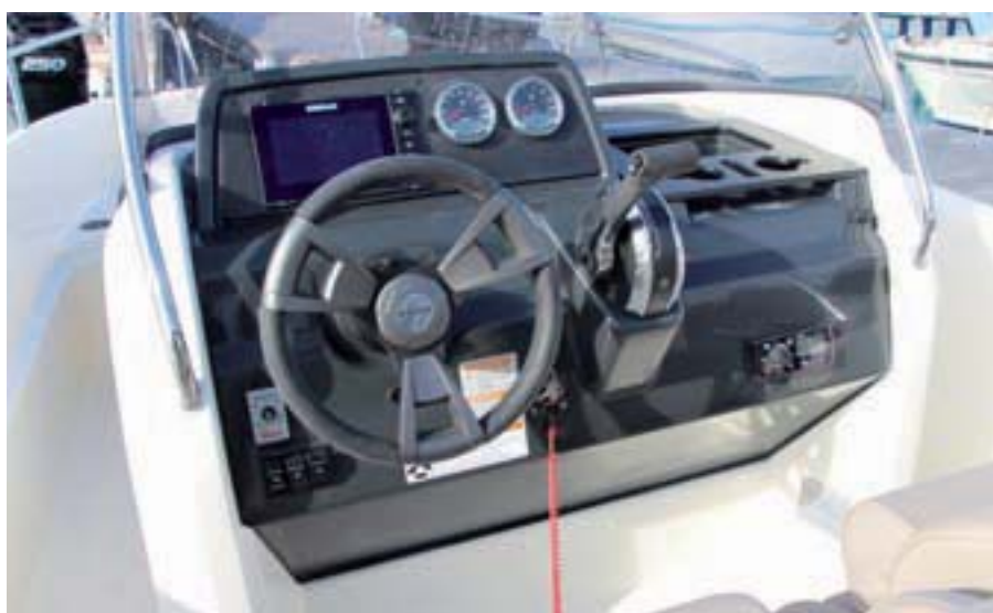
El puesto de gobierno ofrece soportes para electrónica y mandos del motor.