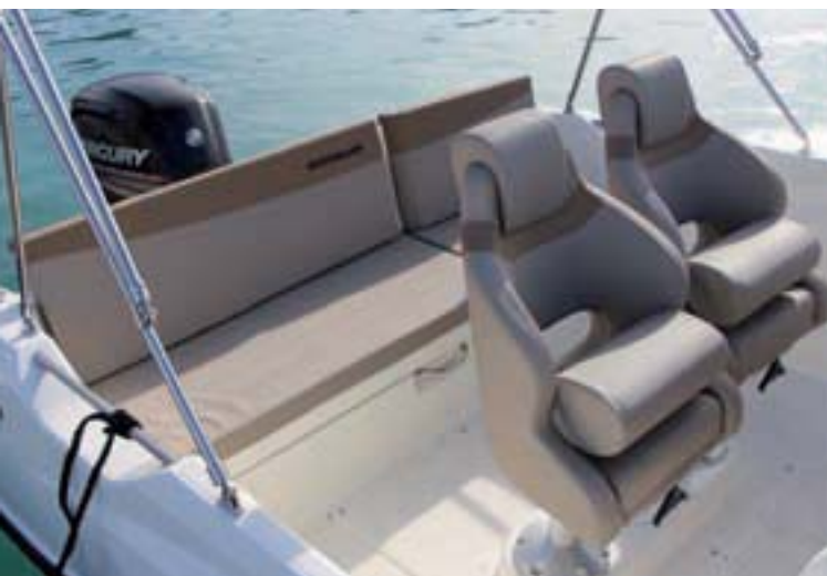
Los dos asientos del piloto son bastante grandes para la eslora.