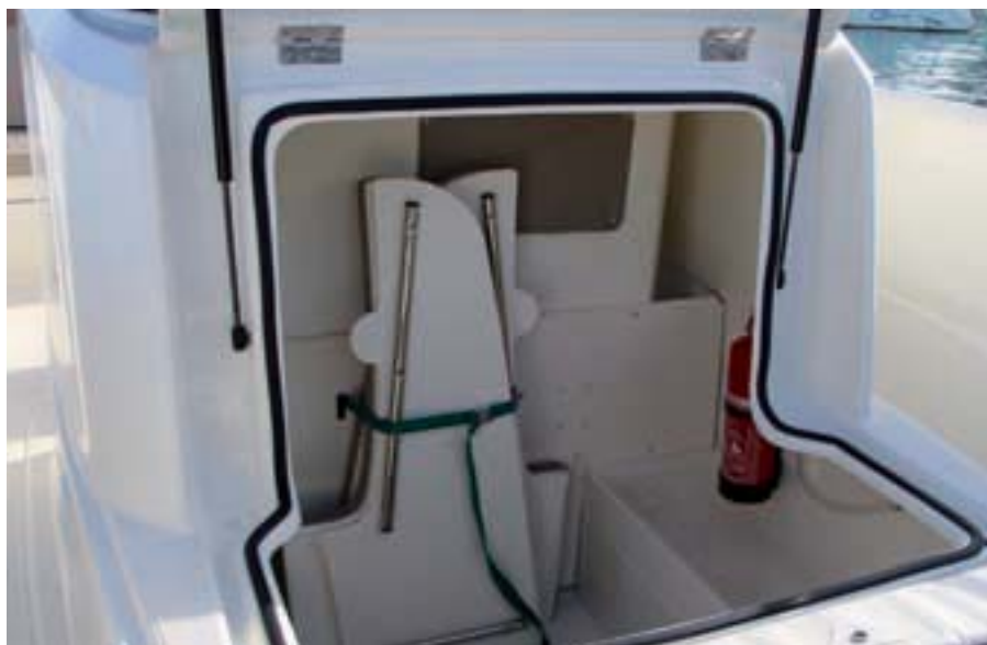
Los complementos del solárium caben en el interior de la consola.