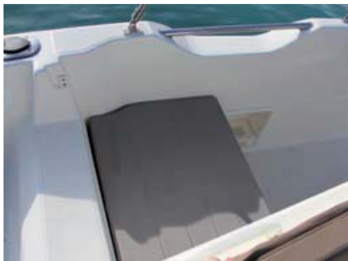
Integra en ambas versiones práctica puerta de entrada en popa.