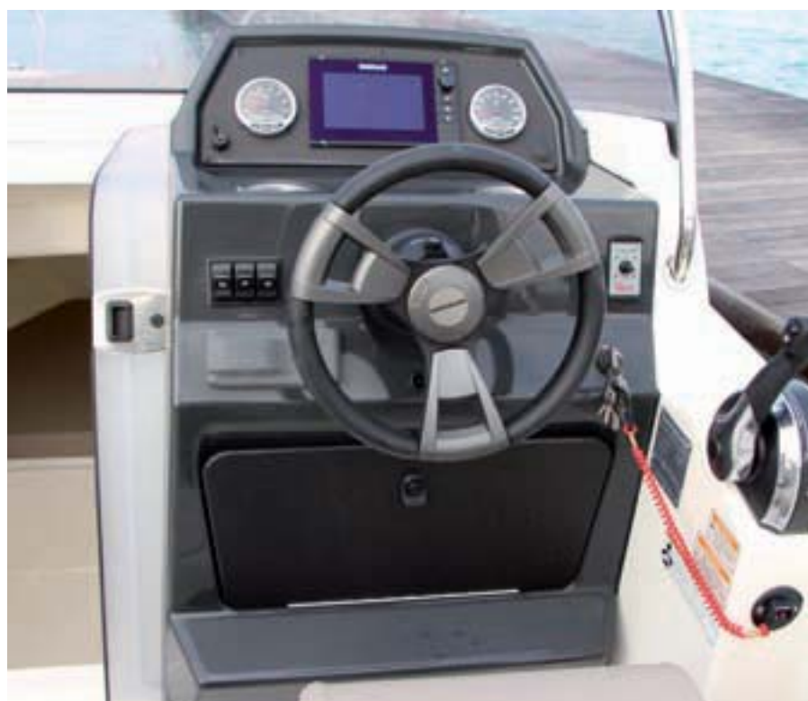
El puesto de gobierno se desplaza a estribor en la Sundeck.

incluido en el perfil delantero, bajo el cofre de fondeo, o permite transformarlo en un solárium mediante suplementos.