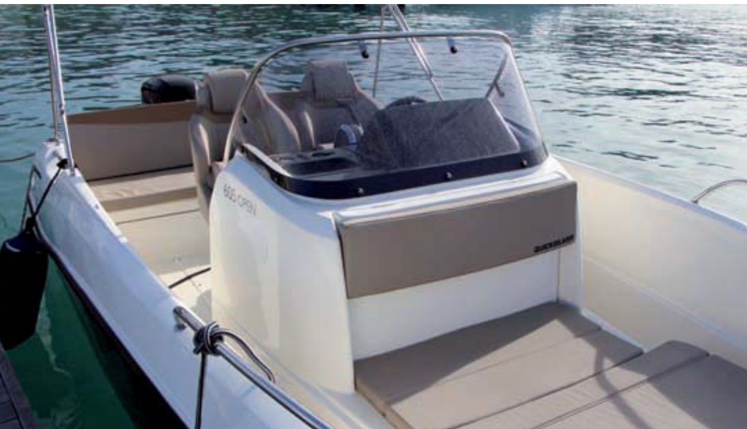
La consola central es ancha y con envolvente parabrisas.

E n continua evolución, la marca Quicksilver, perteneciente a la americana Mercury Marine, amplía su gama de embarcaciones con una interesante propuesta de la línea Activ, mediante una nueva QS Activ 605, que se ha presentado en dos versiones de cubierta, Open y Sundeck. La primera de ellas seguramente será la más polivalente con su cubierta open y la segunda la más enfocada a la navegación de crucero costero, aunque sin olvidar las necesidades del aficionado a la pesca. En ambos casos debemos recordar que uno de los puntos fuertes es la posibilidad de adquirir la embarcación en modo de pack con motores Mercury a precios muy ventajosos.