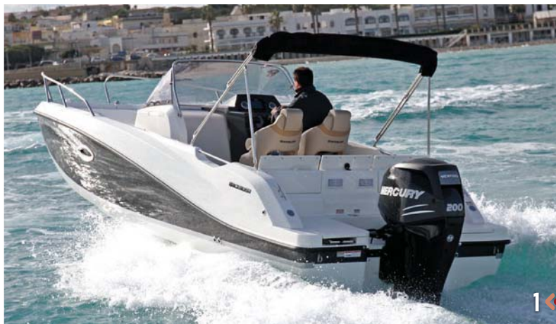
1. La 675 Sundeck se ha remodelado en numerosos detalles, optimizando el confort a bordo y la calidad en general.

El lanzamiento de las Activ 605 y 675 Sundeck viene a sustituir a los modelos actuales. Ambas esloras presentan una cubierta totalmente rediseñada, con nuevas características y funcionalidades. Básicamente se ha mejorado la comodidad a bordo, los aspectos de seguridad y la ergonomía, y además se ha ganado en espacio interior. Su imagen de-