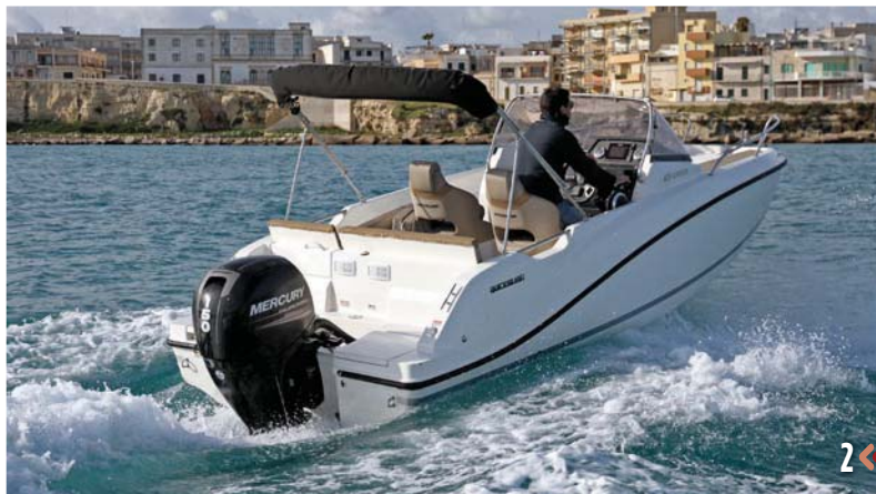
2. La 605 Sundeck sigue el mismo patrón que la 675, con unas prestaciones muy parecidas.

portiva se combina con un estudiado diseño en el que destaca el uso del espacio: ambos modelos cuentan con el solárium más grande de su categoría, una bañera más amplia con una zona de dinete con capacidad para cuatro adultos y una cómoda cabina en forma de U transformable en una cama doble. También se ha incluido