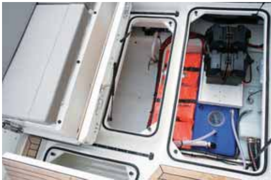
La bañera ofrece gran capacidad de estiba.