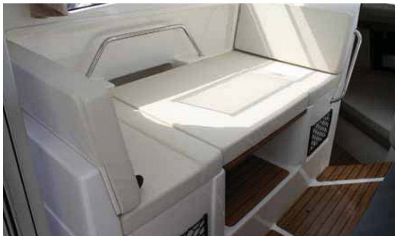
El comedor puede transformarse en cama.