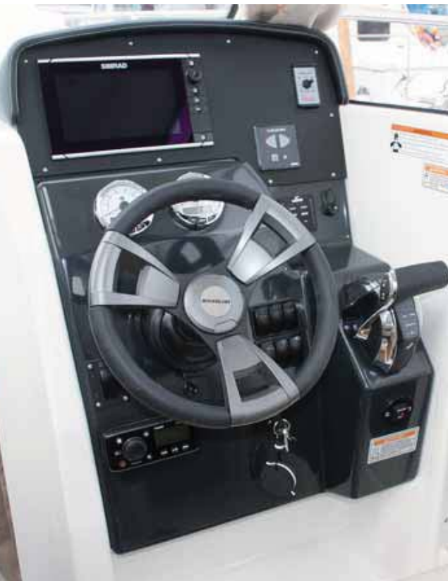
La consola es alta, estrecha y con hueco para pantalla.

C onfort y espacio son los parámetros principales sobre los que se ha desarrollado la nueva Activ 755 de Quicksilver que propone un crucero costero muy aprovechado al que su gran volumen no le impide ofrecer un aspecto moderno y deportivo, con las líneas bien integradas de su gran cabina. Preparada para sustituir a la antigua 705 Cruiser, la nueva propuesta ha sido actualizada con una de las modernas proas cuadradas tan propias de la línea Activ que proporciona una gran habitabilidad a bordo, sobre todo en la parte delantera.