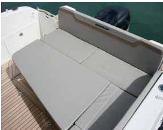
Abatiendo la mesa aumenta el solárium.