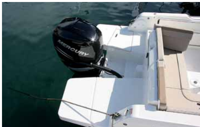
Se añaden dos suplementos para ampliar las plataformas de baño.

gerada dado su enfoque y eslor, pues se trata de una embarcación que busca más el disfrute del mar y del sol. Estamos convencidos de que entre todas las opciones que ofrece el astillero, la combinación más equilibrada es el motor Verado de 250 hp, precisamente el que montaba la unidad que estuvimos probando, y con el que mantiene las prestaciones que corresponden a su enfoque deportivo.