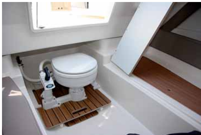
La cabina incluye un inodoro montado sobre carriles.