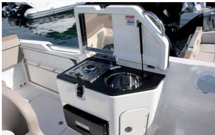
El mueble de la cocina es completo y con una gran tapa de voluminoso cierre.

ocupar toda la manga y formar una dinette con una mesa desmontable de ala plegable y una práctica banqueta lateral escamoteable.