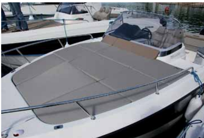
Ofrece un amplio solárium acolchado en la cubierta de proa.