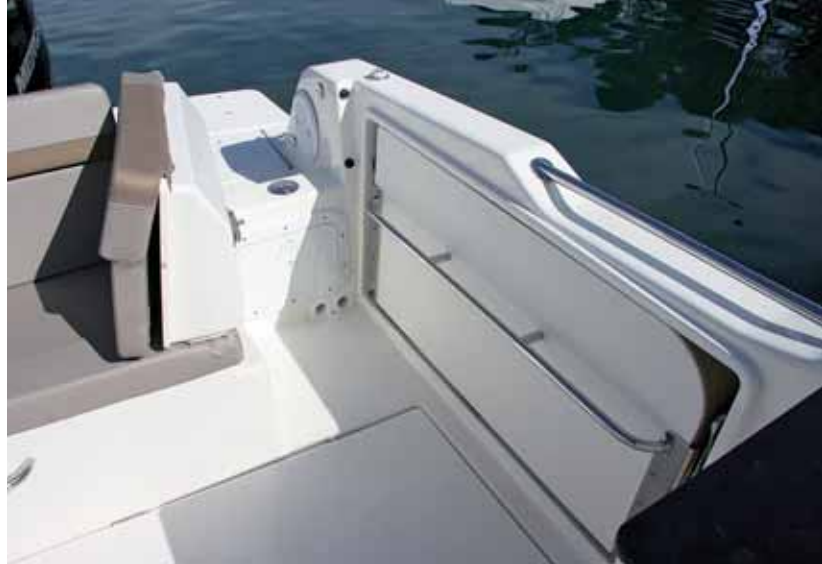
Con el asiento lateral plegable se facilita la entrada por la puerta posterior.

Para este modelo el astillero ofrece en su catálogo potencias de hasta 300 hp; una potencia exa-