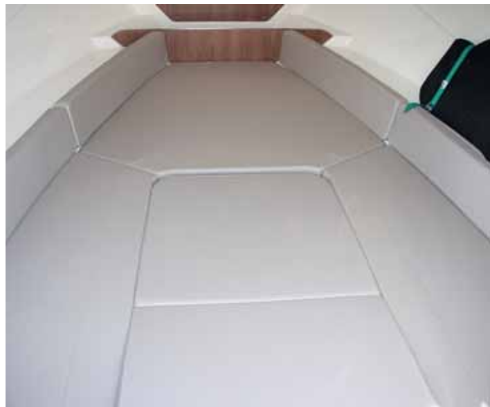
Ofrece en popa una cama doble con el centro desmontable.