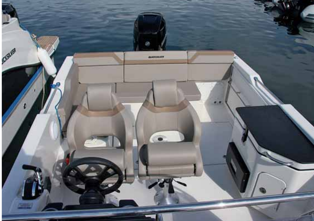
Disfruta de un buen francobordo interior en la aprovechada bañera.