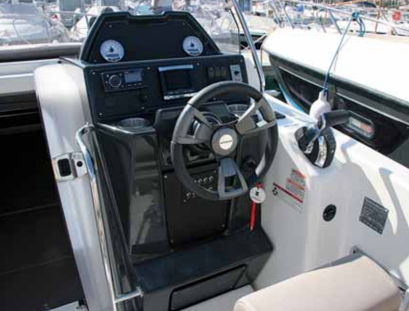
El puesto de gobierno se ha desarrollado sobre un estrecho y compacto molde.