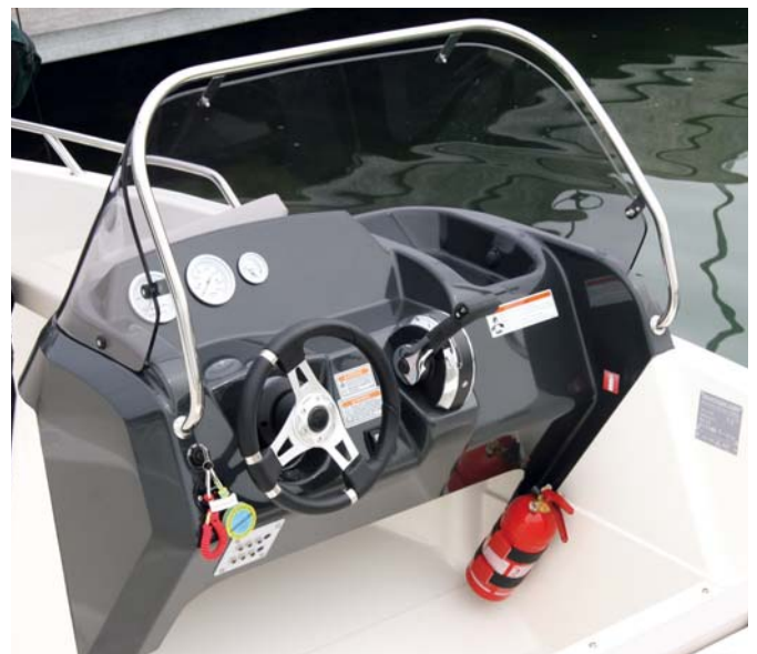
La consola central es ancha, sencilla y de buena protección.