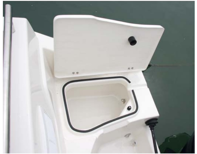
El cofre de la plataforma de popa ofrece diversas posibilidades.