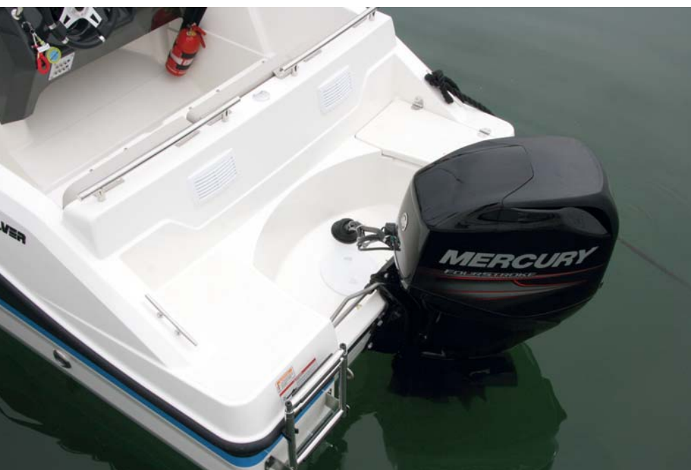
Mantiene en popa dos plataformas integradas, cofre y escalera exterior.