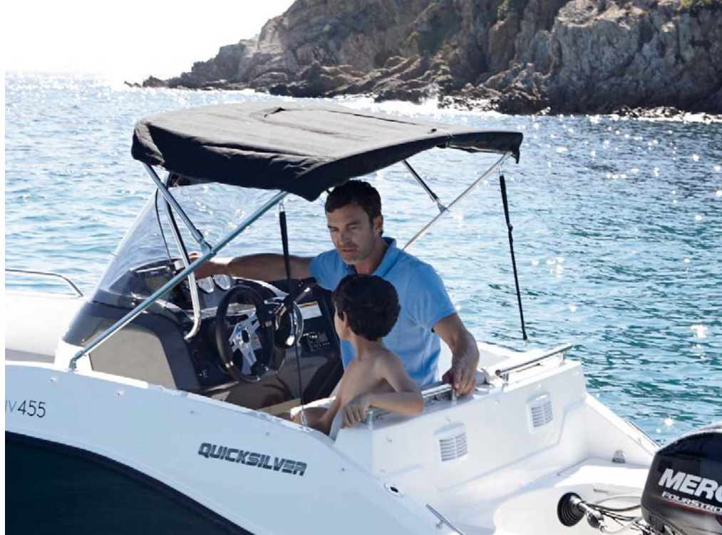
La toldilla plegable de popa protege bien la zona de gobierno.

Con este nuevo modelo, Quicksilver ha desarrollado una atractiva propuesta apta para ser gobernada con la nueva "licencia de navegación", con una QS Activ 455 Open que se nos presenta como una gran propuesta de iniciación o incluso como segunda embarcación de uso polivalente.