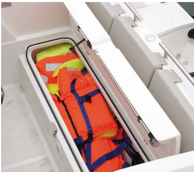
Ofrece una cantidad de espacio de estiba superior a lo que parece.

En la cubierta de proa dispone de dos asientos elípticos enfrentados y un asiento-escalón delantero que, con unos suplementos forman un amplio solárium. Si bien es un espacio práctico para pescar, tal vez le faltaría una pequeña mesa desmontable de serie para crear una dinette.