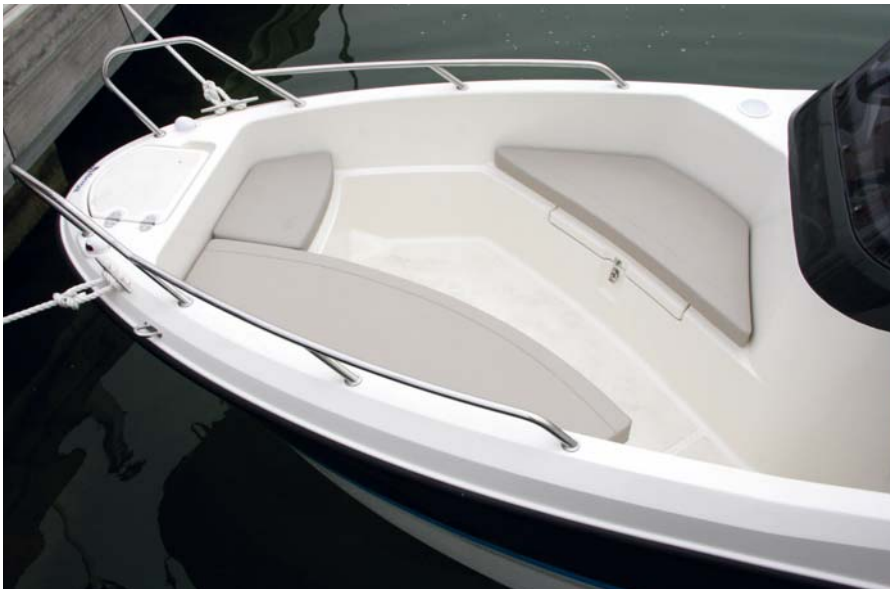
Buena parte de cubierta se destina a los asientos enfrentados de proa.

bañera, con una escalera plegable de estiba exterior.