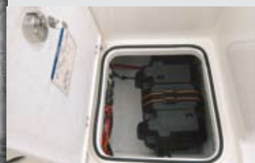
Este cofre, en la sección de estribor de popa de la bañera, sirve para estibar y dar acceso a las baterías.

P or las características del diseño destaca, por supuesto, la bañera, de dimensiones generosas, pero también la oferta de hasta cuatro packs de opcionales encargados de adaptar el barco a las necesidades de cada armador. A través de ellos puede ampliarse la dotación de pesca, de la cabina o de la bañera, mientras que la Edición Smart integra los tres packs anteriores a un precio competitivo y con cortos plazos de entrega.