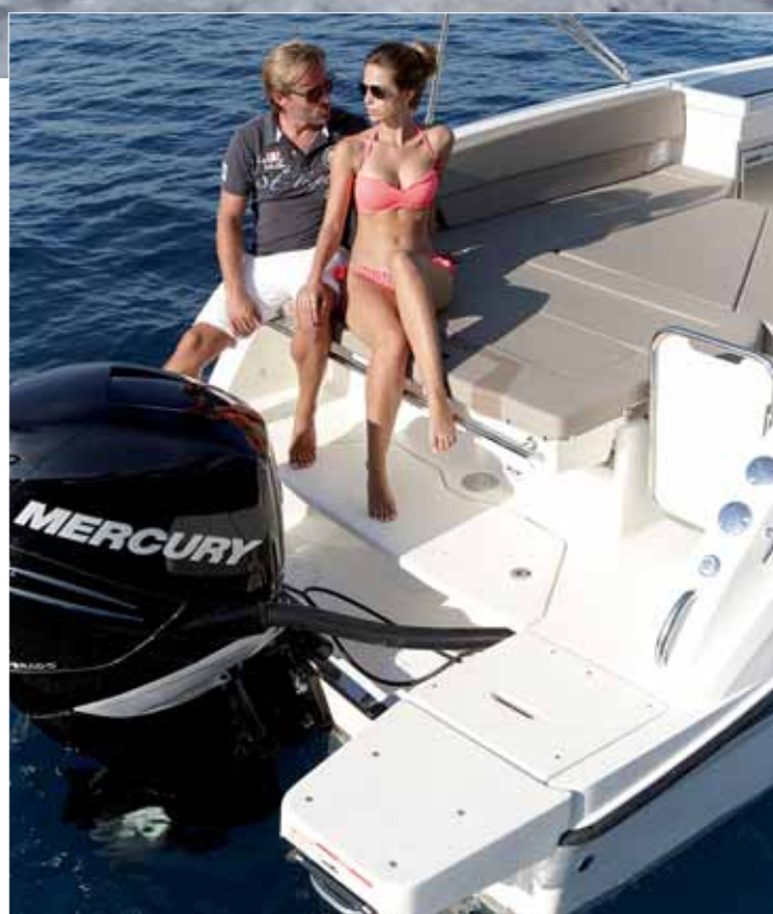
La zona de popa se puede combinar para crear un gran solárium.

costera, en el que se ha buscado el máximo aprovechamiento a la hora de disfrutar del sol. Coincide también que este modelo es el de mayor eslora de la línea Activ con cubierta Sundeck, y que aprovecha bien la plataforma de gran tamaño realizada sobre un casco de buen volumen y preparado para un potente fueraborda que deja mucho espacio libre en cubierta.