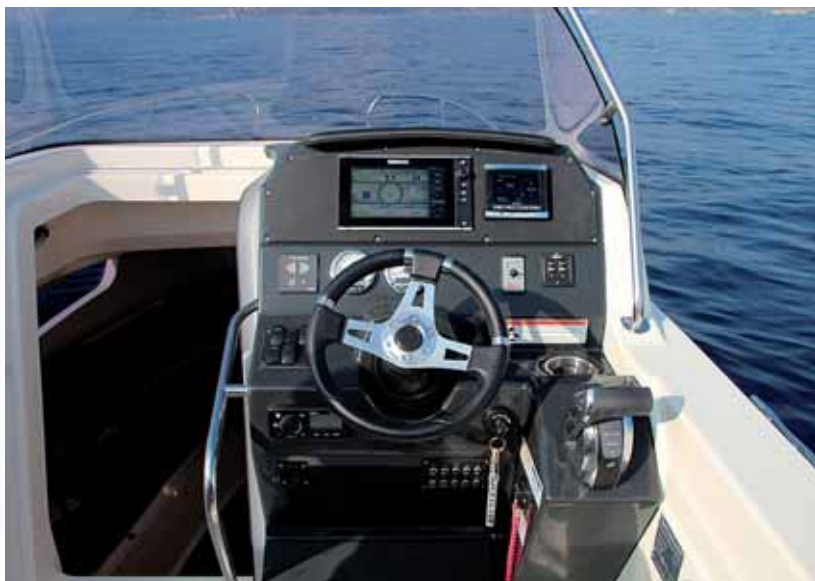
El puesto de gobierno queda totalmente desplazado a estribor.

Acompañados por representantes del importador para España de Quicksilver, la empresa Touron, contamos con una Activ 805 Sundeck montada con un solo motor fueraborda Mercury Verado de 300 hp, de gran potencia, aunque el astillero ofrece diversas opciones