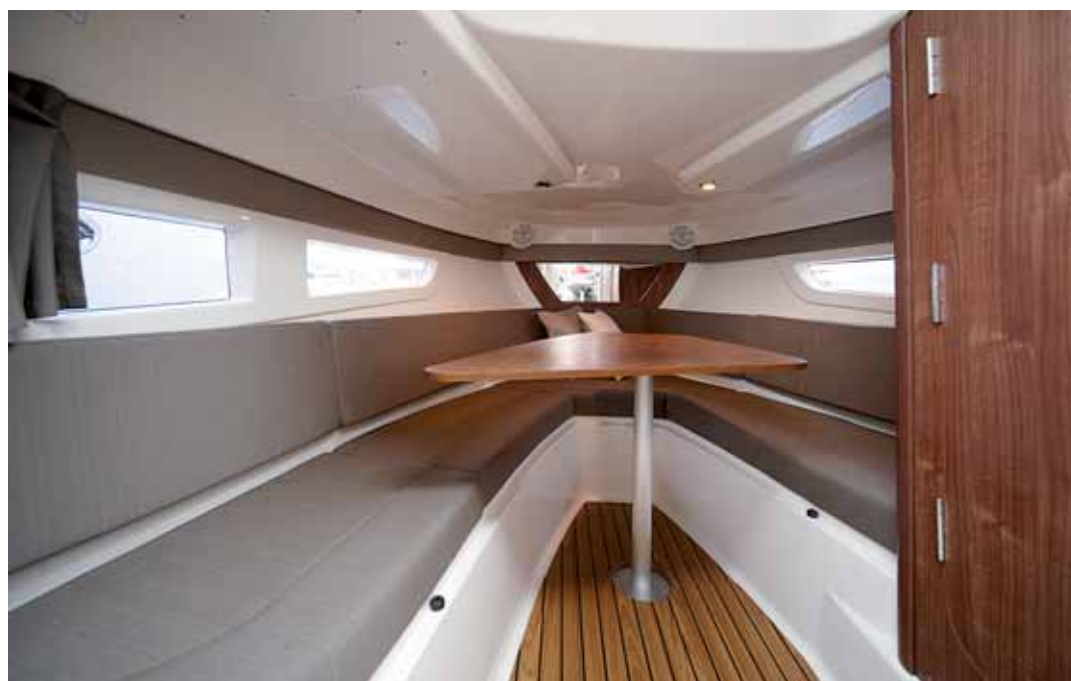
Bajo cubierta se consigue una capacidad considerable con aseo independiente.

de potencias, entre 250 y 400 hp entre montajes simples o dobles.