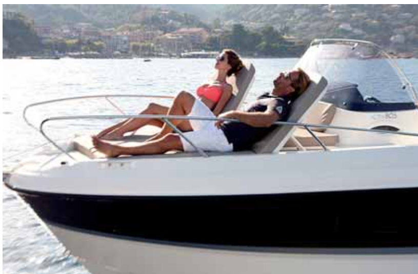
Adopta dos prácticos respaldos practicables de gran altura en proa.